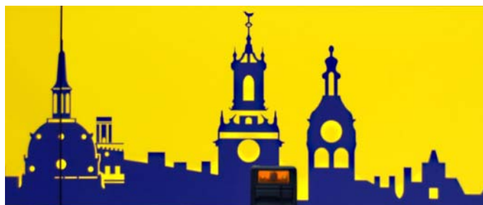
Det finns många torn i Stockholms siluett, i varje fall på bussen.