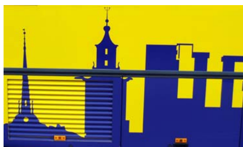
Tornet i mitten känner vi till. Och kanske det till vänster. Men det till höger ..?