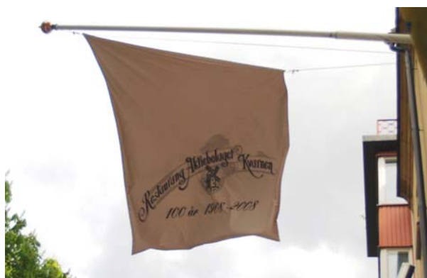
Lunchen intogs på Restaurang Kvarnen, känt hak för inbitna Hammarbajare.