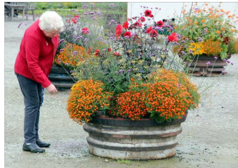
Trots att hösten närmade sig, fanns en mångfald blommor och växter att begrunda och närmare undersöka.