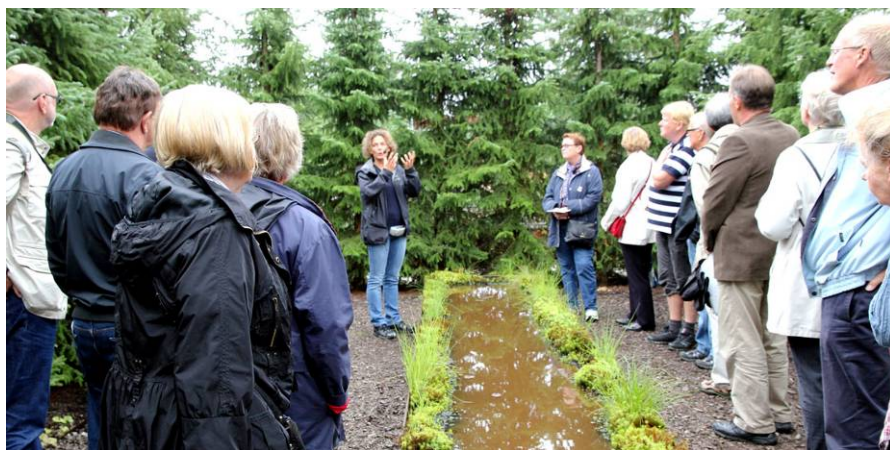
En engagerad guide avslutade visningen vid tjärnen i "Skogens trädgård"