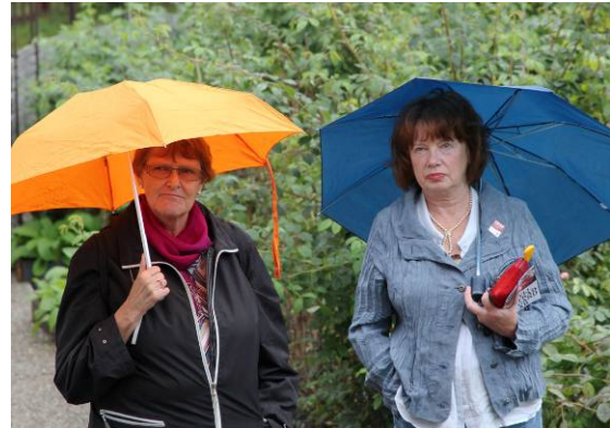
Paraplyer var bra att ha, några droppar föll i början men se'n blev det uppehåll.