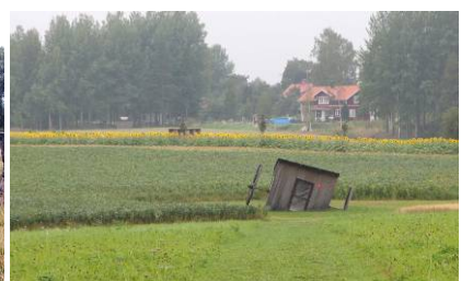
Sköna miljöer finns det gott om i trädgården: blommor, vatten och installationer.