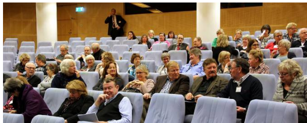
Ett 80-tal blivande och varande If-pensionärer var på plats.